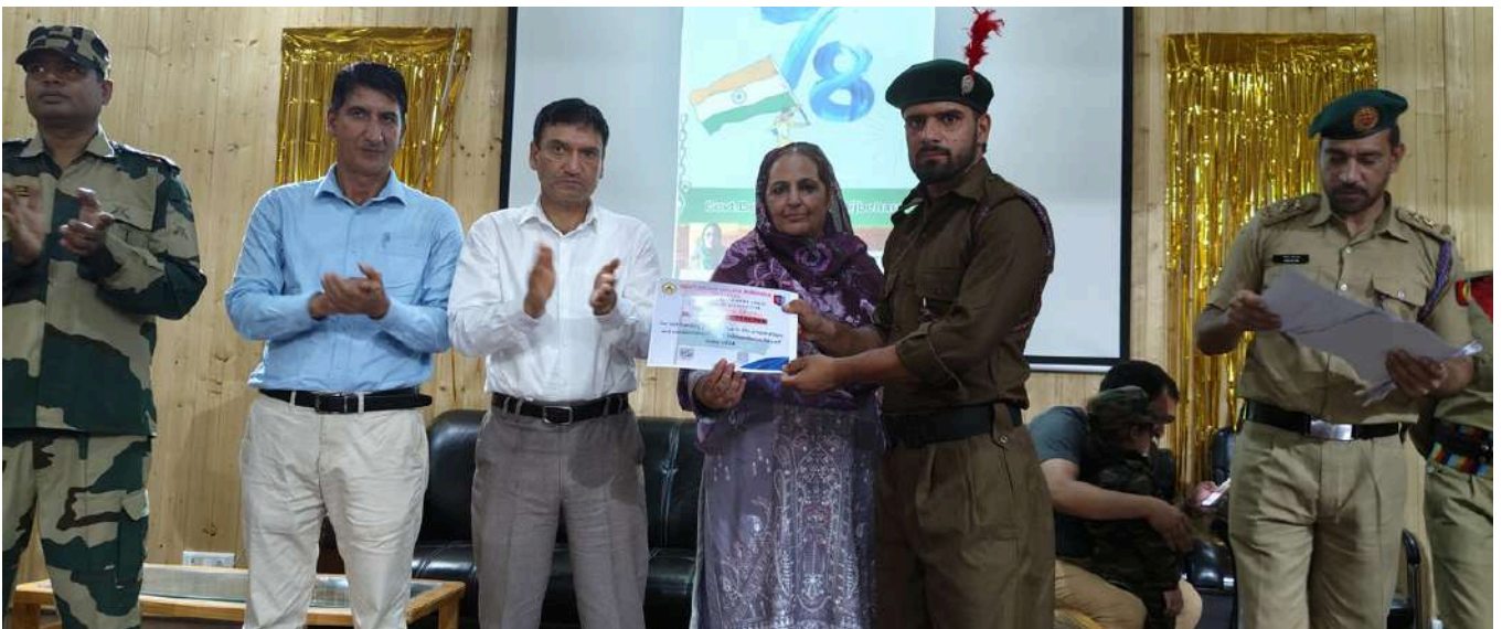
Cultural Program during Independence Day Celebrations at GDC Bijbehara on August 15, 2024.