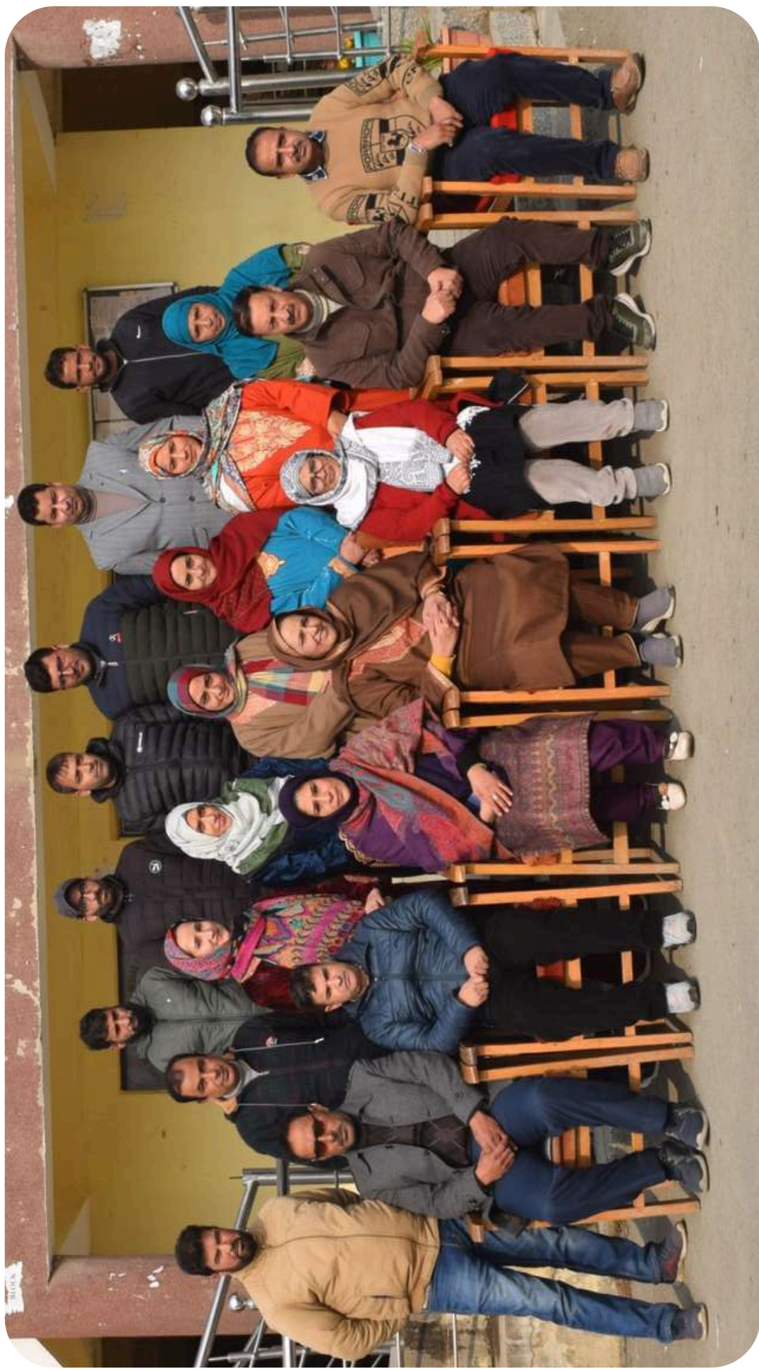
Principal with Non - teaching Staff GDC Bijbehara