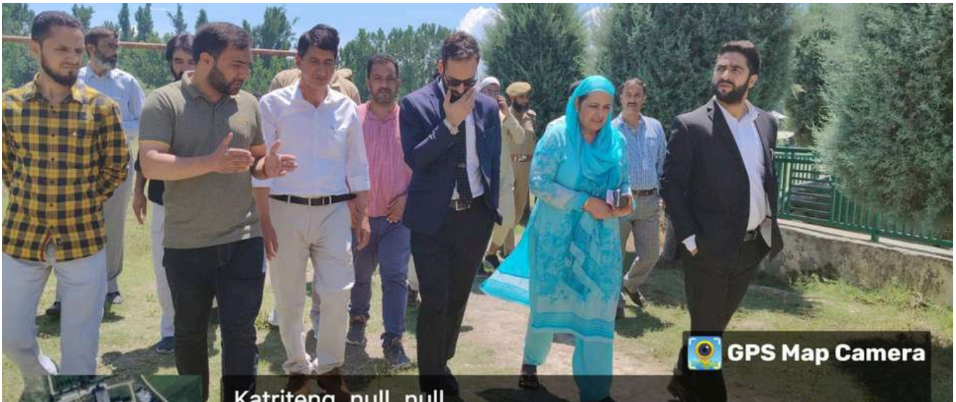
A visit by Session Judge on the occasion of International Youth Day, Organized by GDC Bijbehara in collaboration with Tehsil Legal Services Committee Bijbehara and District Legal Services Authority Anantnag on 12 August 2024