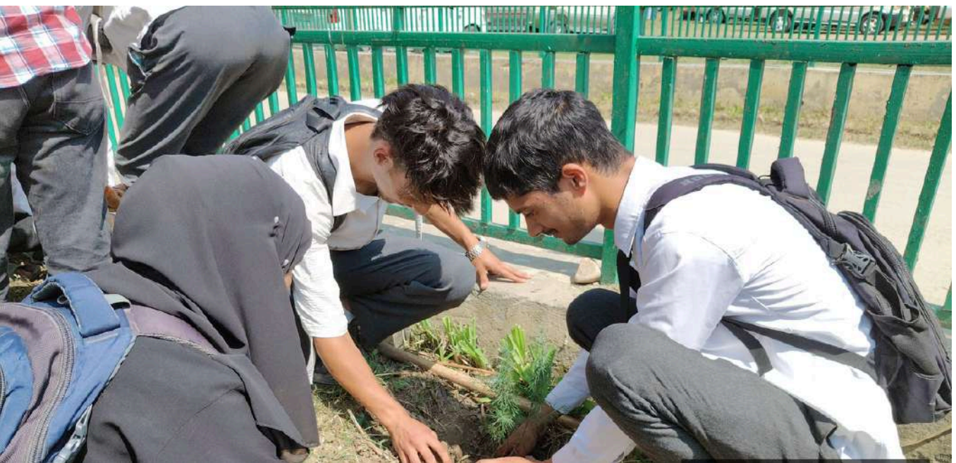
Plantation drive within College Campus by Staff and Students on 14th September 2024