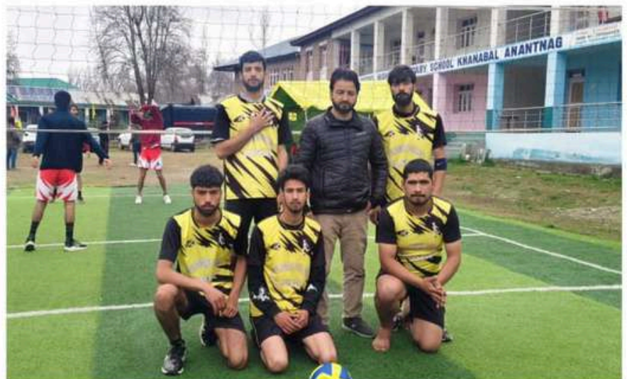
Volleyball match of GDC Bijbehara at Shri SRJ Higher secondary school khanabal against Spartan club Anantanaag on 12 /03/2025. Volleyball tournament organised by District Police Ananatnag.