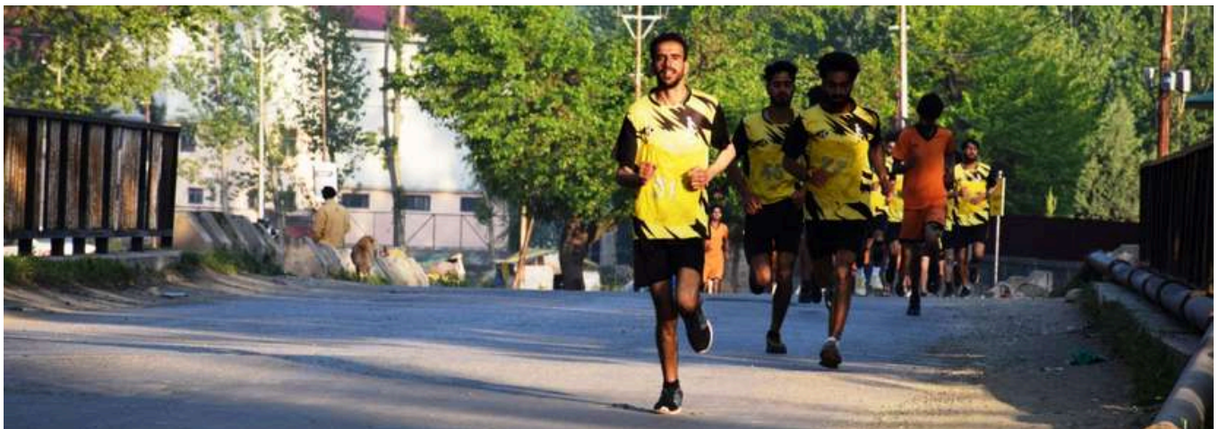
Participation of Students and Staff in Annual Road Race-2024