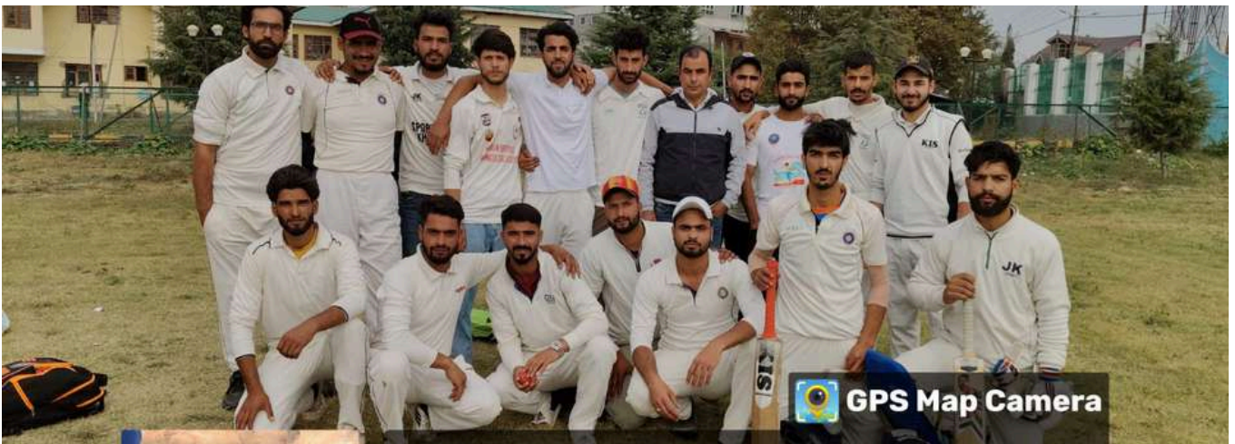
Participation of College Cricket Team in Inter-College Cricket Tournament at University of Kashmir, Srinagar.