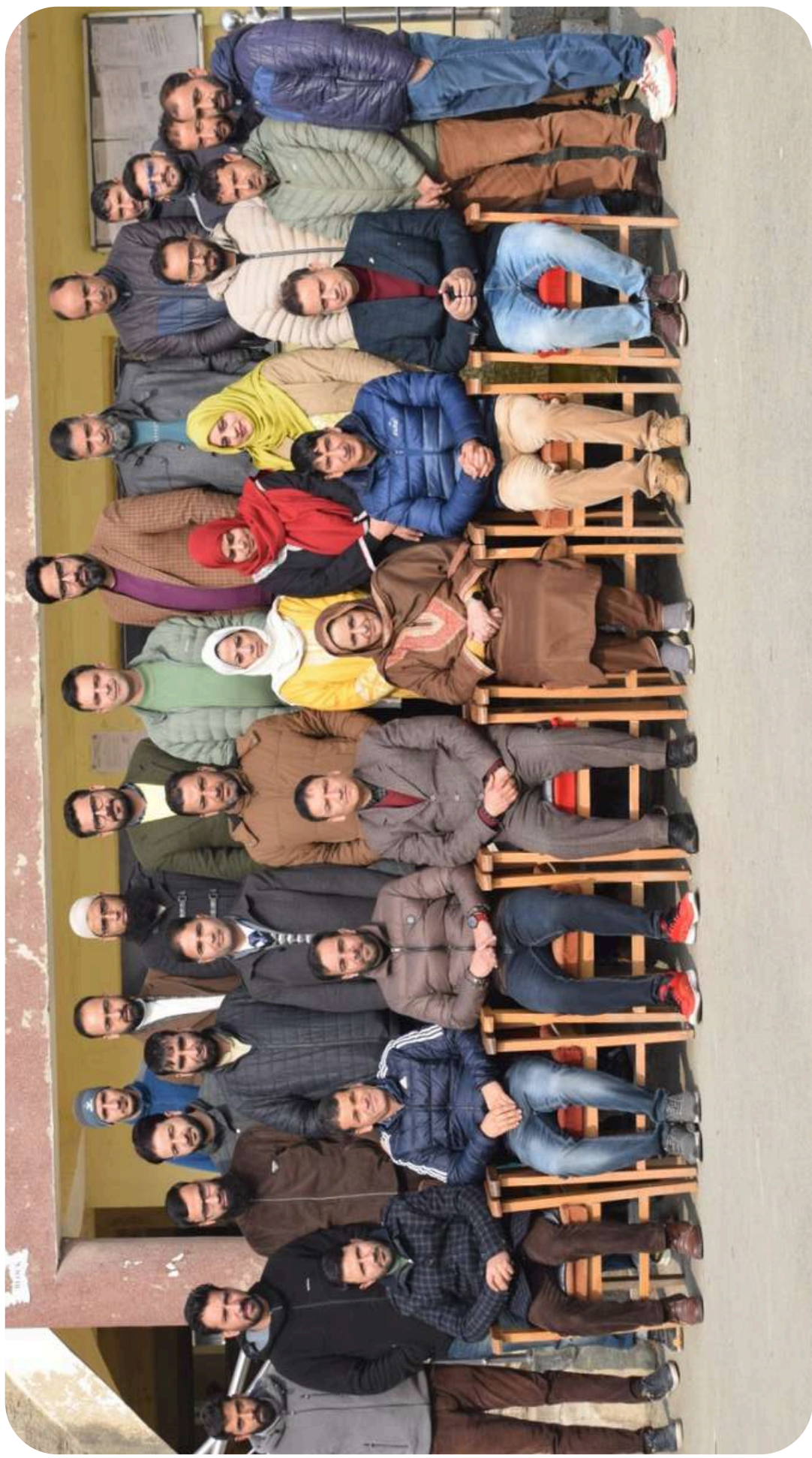
Principal and Faculty GDC Bijbehara