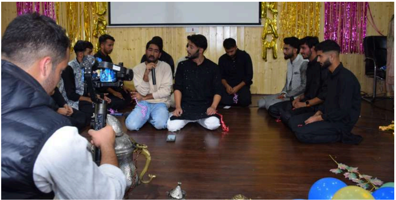
Cultural Programme-cum-farewell Party for the outgoing BG 6th Semester students of GDC Bijbehara.