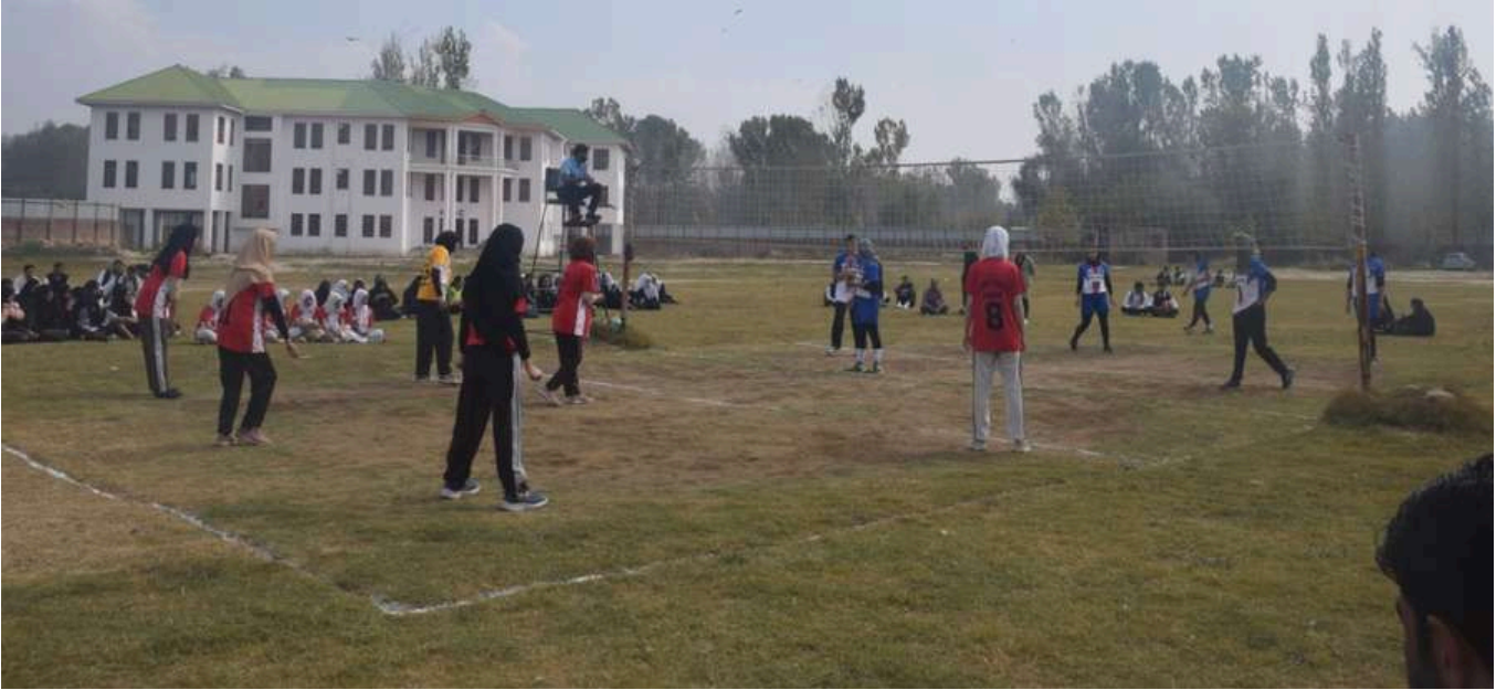
Inter-district Volleyball championship for Women held at GDC Bijbehara