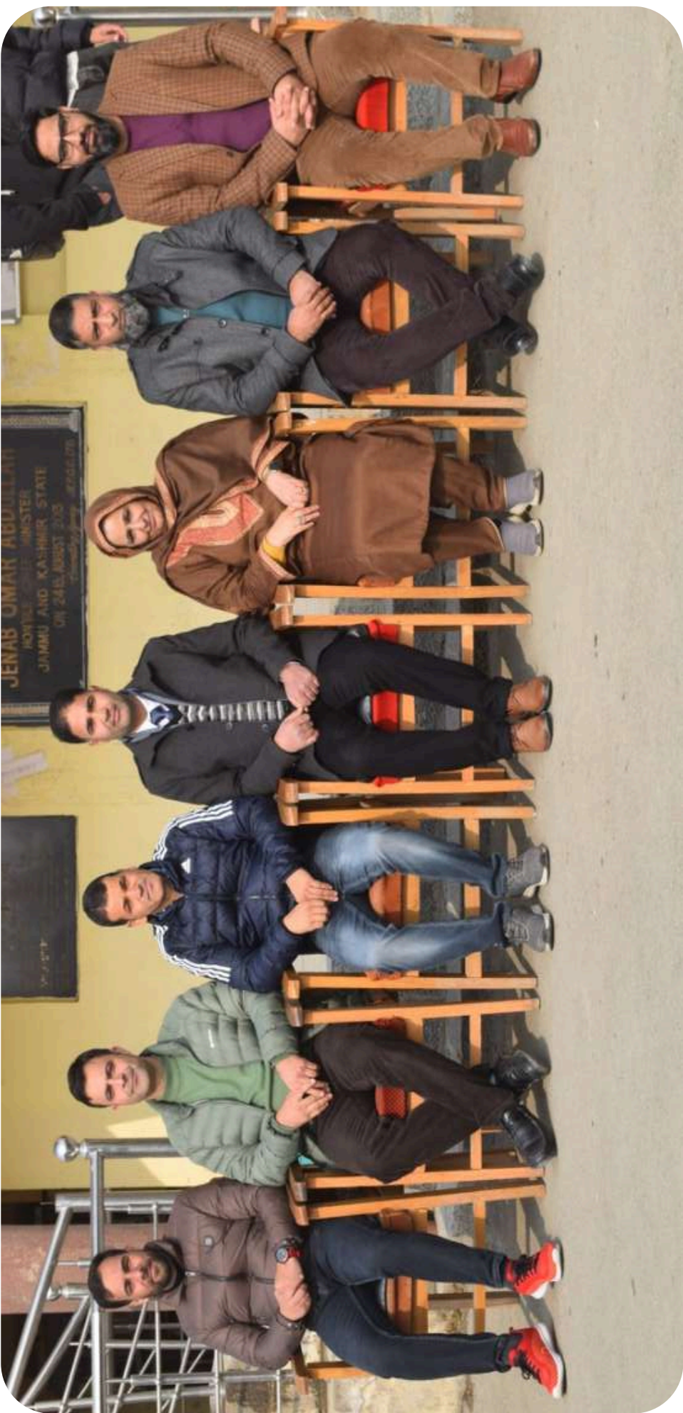
Editorial Board, GDC Bijbehara