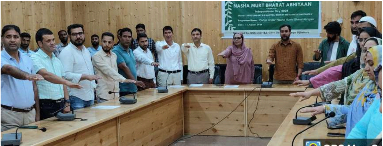
Nasha MukT Bharat Abhiyan” pledge taken by students and staff members on 13.08.2024 in the College Conference Hall.